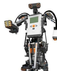
1. kép: Az NXT-széria

Az első generáció sikerein felbuzdulva és azt leváltva 2006-ban megjelent az LEGO® MINDSTORMS NXT, majd 2009-ben ennek a frissített változata, az NXT 2.0. 2013-ban mutatták be a jelenlegi legfrissebb, harmadik generációt, az EV3-at, amit azóta is előszeretettel használnak otthon, az oktatásban és a különböző robotikaversenyeken, úgy mint pl. a FIRST® LEGO® League vagy a World Robot Olympiad™ során.