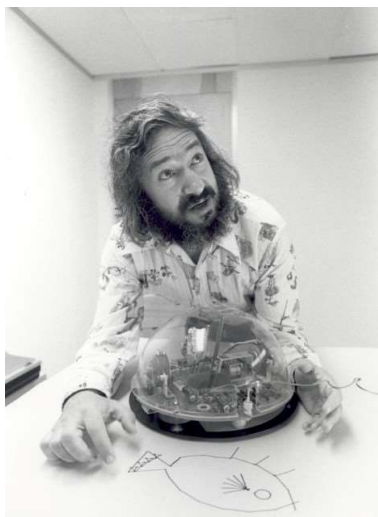
1. kép: Seymour Papert munka közben

A programozható LEGO® elemek története a Massachusettsi Műszaki Egyetemről, az MIT-ről indult el, az egyetemi hallgatók robotikaoktatását akarták ezzel gyakorlatiasabbá tenni. A LEGO® Technic elemek 1977-es megjelenésével már olyan összetett mechanikai szerkezeteket lehetett megvalósítani, amik elektromos motorok beépítésével képesek voltak irányítottan megmozdulni.